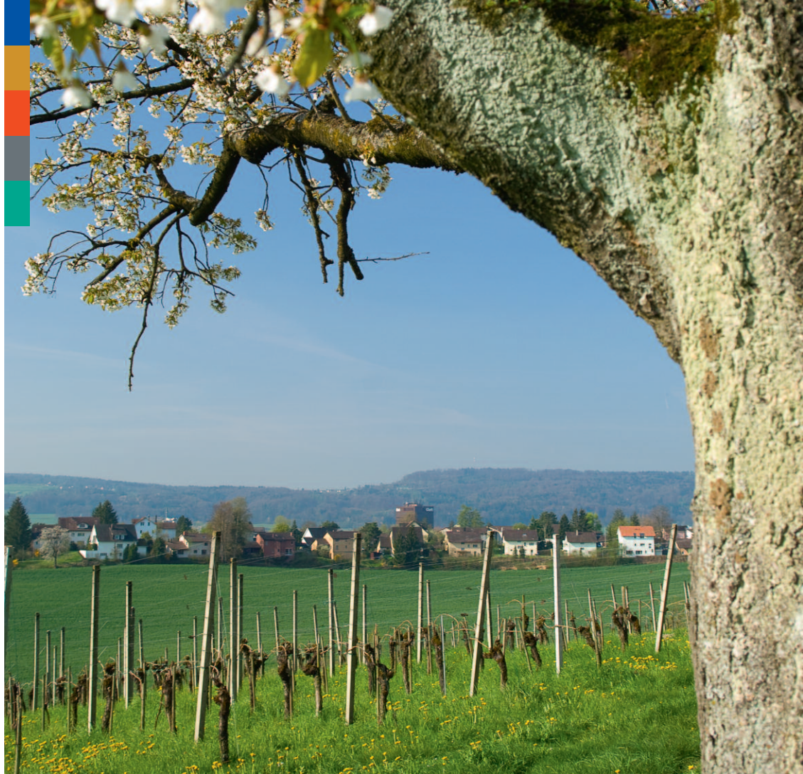
8.2010 DK z. Auflage 100% Recycling – aus Verantwortung für unsere Umwelt